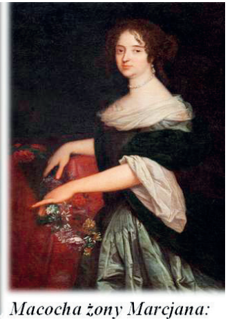
Macocho żony Marcjana: siostra Marii Kazimiery: Maria Anna d'Arquien

mi bodaj z sukcesji po panu komorniku”, a takim również tytułem „komornika krakowskiego” opisywano Jana Chryzostoma Paska, zmarłego w c. 1701 roku.